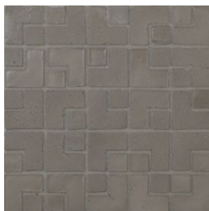
LMB 194 - Fango