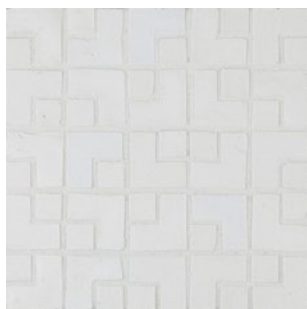
LMB 180 - Talco