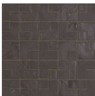
LMB 198 - Ebano