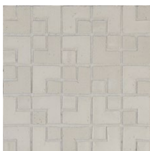
LMB 185 - Riso