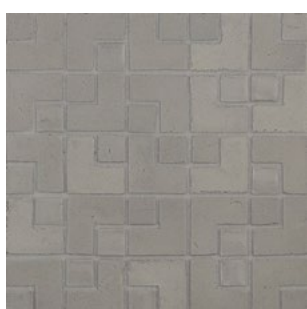
LMB 190 - Cenere