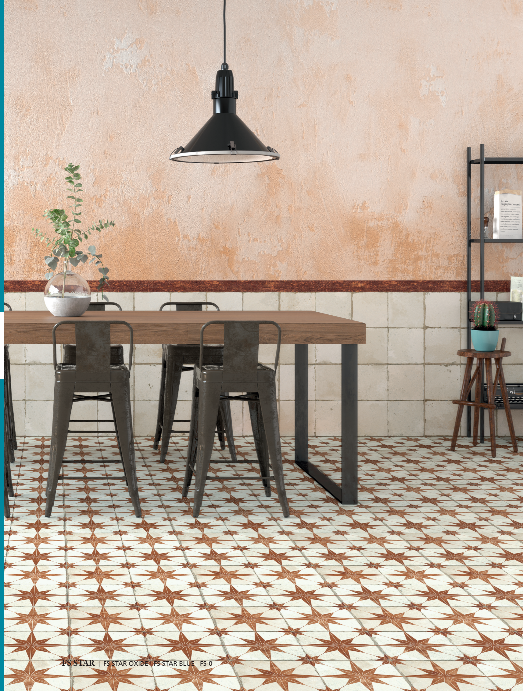
FS STAR | FS STAR OXIDE | FS STAR BLUE | FS-0